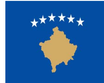
Republic of Kosovo