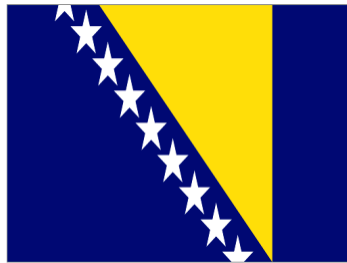
Serbia & Herzegovina