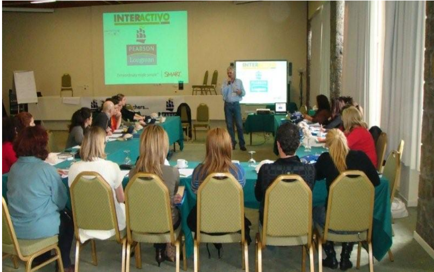
INTERACTIVO & LONGMAN PEARSON Cooperation Events December 2008